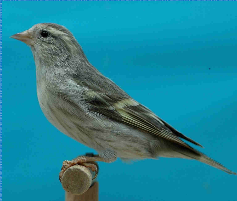
Erlenzeisig achat ivoor 0.1