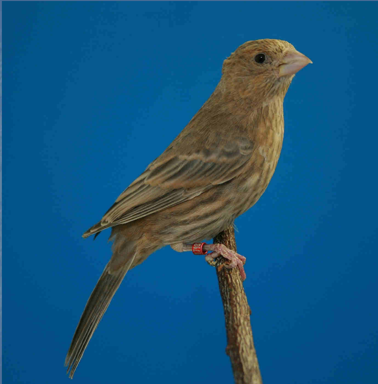
Hausgimpel braun 0.1